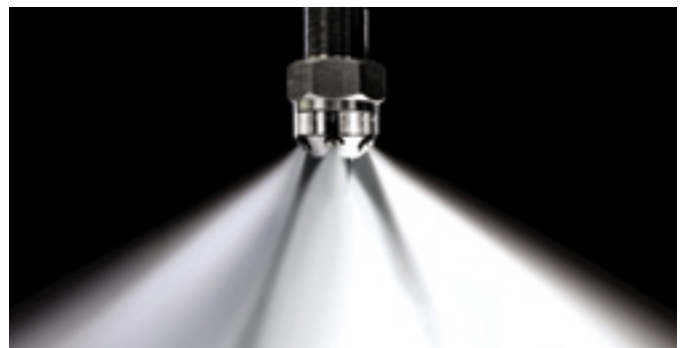
Mlaznica za raspršivanje vodene magle

Voda je zbog odlične energije apsorpcije vrlo učinkovito sredstvo za gašenje. No učinkovitost upotrebe u klasičnim oblicima gašenja s cijevima i topovima, kao i uobičajenim sprinkler