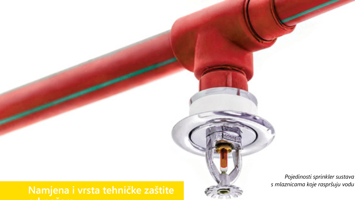
Pojedinosti sprinkler sustava s mlaznicama koje raspršuju vodu