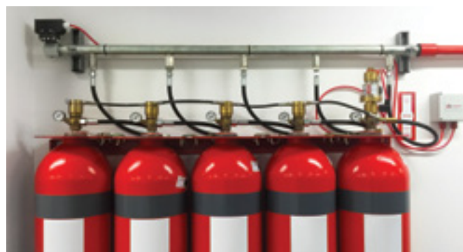
Cilindri inergena povezani u sustav

Inergen je mješavina plinova koju sačinjavaju dušik, argon i ugljikov dioksid. Požar gasi tako da snizi koncentraciju kisika na razinu između 12 % i 15 %. Sustavi inergen oblikovani su tako da otkriju i ugase vatru (potpuna poplava) u početnoj fazi požara, prije nego nastane šteta, dok istovremeno koncentracijom sredstva za gašenje u prostoru omogućavaju vrućim površinama da se ohlade. Fiksna opskrba sredstvom za gašenje inergen priključena je na razvod cijevi sa sapnicama koje usmjeravaju sredstvo u zatvoren i zaštićen prostor. Svi plinovi od kojih se sastoji inergen prisutni su u prirodi tako da on ne oštećuje okoliš, a nema utjecaja ni na ljude u objektu. Čovjeku je za disanje potrebno približno 10 % kisika. Pri ulasku plina inergen u prostor koncentracija kisika u zraku spušta se s uobičajene razine 21 % na razinu ispod 15 % i vatra se gasi.