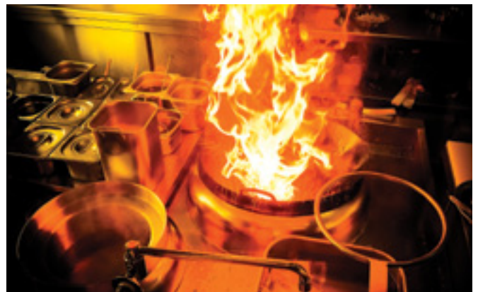
Kuhinja je potencijalno opasan prostor za nastanak požara

U kuhinjama u hotelima, ugostiteljskim lokalima, stambenim kućama, stanovima itd. prijete veća opasnost od požara nego u ostalim prostorijama. U pogledu uzroka nastanka požara na prvom su mjestu električna kuhala, užareni elementi za pečenje, otvorena vatra, elementi za pečenje krumpira, friteze, mikrovalne pećnice, obične pećnice, masne cijevi napa, ventilatori obloženi mašću i plinski roštilji. Takav se požar vrlo brzo širi i vrlo ga je teško ugasiti.